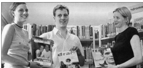
Offizielle Übergabe von Unterstützungsabos durch Freunde in einer Bibliothek

➤ Spenden Sie per Einzahlungsschein mit dem Vermerk »Spendenprojekt 2062« für Unterstützungsabos auf unser Postkonto 80-51751-1 (Verein Jugendzeitschrift Teens, 8330 Pfäffikon ZH). Wir verwenden das Geld zweckbestimmt für dieses Projekt.